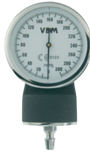
Manomètre 300 mmHg REF 20-16-300