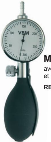
Manomètre 300 mmHg avec poire pour pompage manuel et valve d'échappement REF 20-18-300