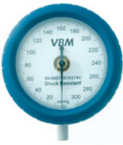
Manomètre 300 mmHg anti-choc REF 34-17-300