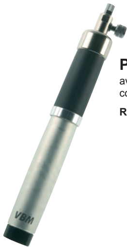
Pompe à main avec valve d'échappement et connexion Luer Lock mâle REF 51-30-000