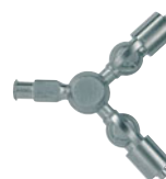
Robinet 3 voies avec deux connexions Luer Lock mâle et une connexion Luer Lock femelle REF 51-02-000