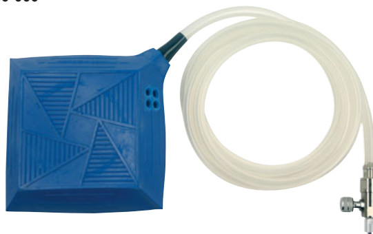
Pompe à pied avec 2 m de tube en silicone, valve d'échappement et connexion Luer Lock mâle REF 51-20-000