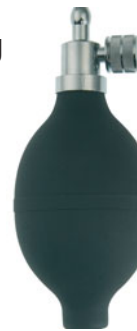
Poire pour pompage manuel avec valve d'échappement REF 51-10-666