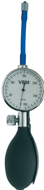
Manomètre 300 mmHg avec poire pour pompage manuel, valve d'échappement et connexion Luer Lock mâle REF 51-09-666