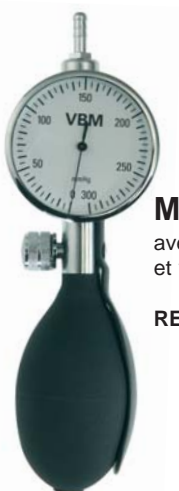
Manomètre 300mmHg avec poire pour pompage manuel et valve d'échappement REF 20-18-300