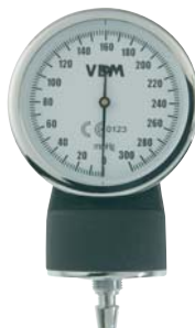
Manomètre 300mmHg REF 20-16-300