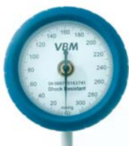
Manomètre 300mmHg anti-choc REF 34-17-300