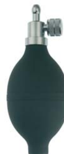
Poire pour pompage manuel avec valve d'échappement REF 51-10-666