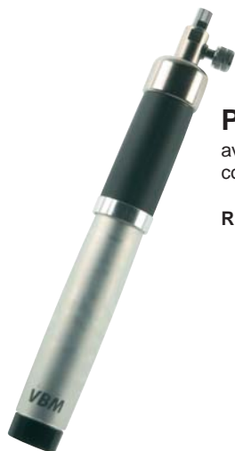
Pompe à main avec valve d'échappement et connexion Luer Lock mâle REF 51-30-000