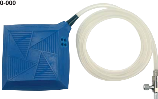
Pompe à pied avec 2m de tube en silicone, valve d'échappement et connexion Luer Lock mâle REF 51-20-000