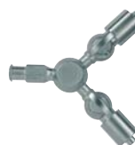
Robinet 3 voies avec deux connexions Luer Lock mâle et une connexion Luer Lock femelle REF 51-02-000