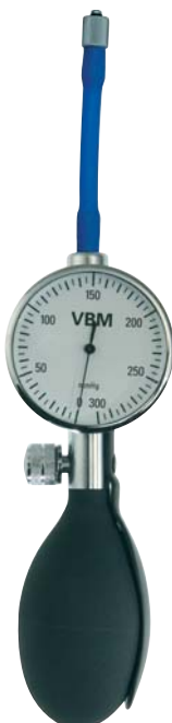
Manomètre 300mmHg avec poire pour pompage manuel, valve d'échappement et connexion Luer Lock mâle REF 51-09-666